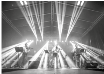
FOT. ZESPÓŁ GÓRALSI